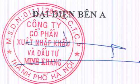
HOÀNG ĐÌNH HÙNG

- Hợp đồng này được lập thành 02 bản có giá trị như nhau, mỗi bên giữ 01 bản làm căn cứ pháp lý và thực hiện.