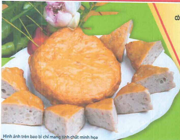
Hình ảnh trên bao bì chỉ mang tính chất minh họa

Sản phẩm sản xuất độc quyền cho CÔNG TY TNHH MỘT THÀNH VIÊN THƯƠNG MẠI VÀ DỊCH VỤ NGỌC THOM