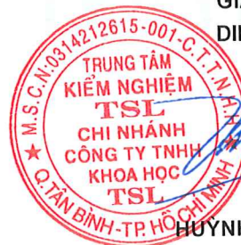
HUYNH TÁN CƯỜNG