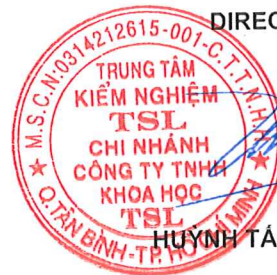
HUYỀN TÁN CƯỜNG