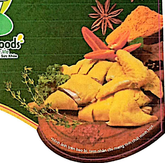
*Hình ảnh trên bao bì, tem nhãn chỉ mang tính chất minh họa.