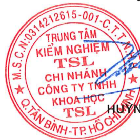
HUYỀN TÂN CƯỜNG